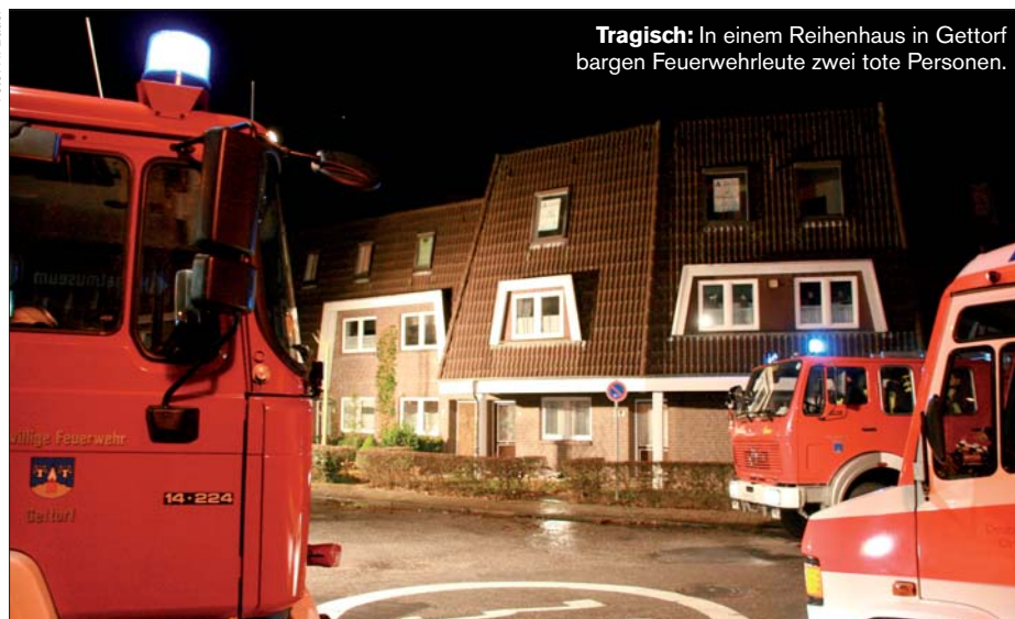
Tragisch: In einem Reihenhaus in Gettorf bargen Feuerwehrleute zwei tote Personen.

T ragischer Einsatz für die Freiwillige Feuerwehr Gettorf: In einem Reihenhaus in der Bergstraße war aus bislang unbekannter Ursache ein Feuer ausgebrochen. Die