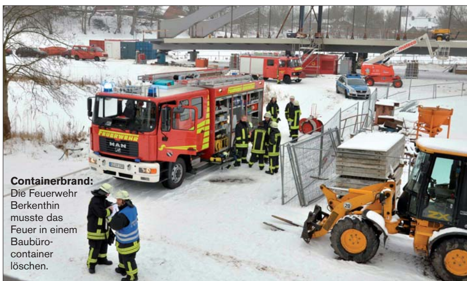
Containerbrand: Die Feuerwehr Berkenthin musste das Feuer in einem Baubürocontainer löschen.

Die Feuerwehrmänner retteten die Baupläne sowie wichtige Unterlagen zum Bau der neuen Brücke. „Ich möchte gar nicht daran denken, wenn diese Unterlagen in den Flammen verbrannt wären“, ergänzt Papalia. Bei den anschließenden Nachlöscharbeiten wurde die glimmende Isolierung an der Decke der Nasszelle entfernt. Christian Nimtz