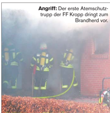
Angriff: Der erste Atemschutztrupp der FF Kropp dringt zum Brandherd vor.

Der Brand wurde ausschließlich im Innenangriff bekämpft und konnte durch die eingesetzten Atemschutzgeräteträger schnell unter Kontrolle gebracht werden.