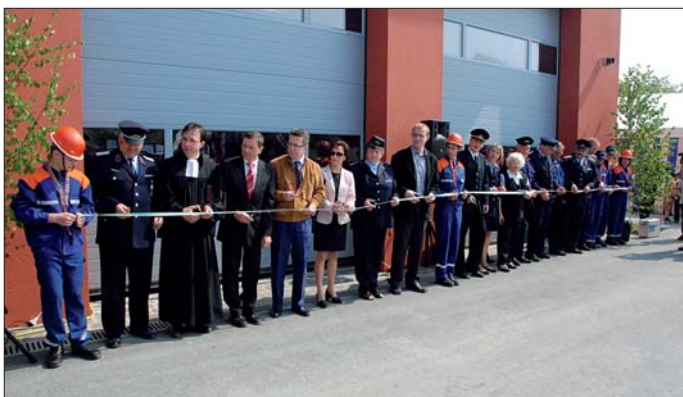
Einweihung: Die Krögiser Kameraden und ihre Ehrengäste durchschnitten gemeinsam das Einweihungsband.