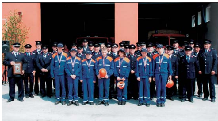
Jubiläum 2019: Die 28 Aktiven, 12 Veteranen und acht Mitglieder der Jugendfeuerwehr feierten mit zahlreicher Prominenz das Jubiläum der Wehr.