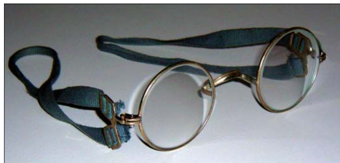
Unzulässig: So genannte „Gasmaskenbrillen“ sind für den Feuerwehreinsatz nicht zulässig, da sie die Dichtlinie der Atemschutzmaske beeinträchtigen.

Nach der FwDV 7 „Atemschutz“ muss ein Atemschutzgeräteträger, der das erforderliche Sehvermögen nur mit einer Brille erreicht, eine innen liegende Maskenbrille benutzen. Dies gilt für Einsätze und Übungen. Die Maskenbrille