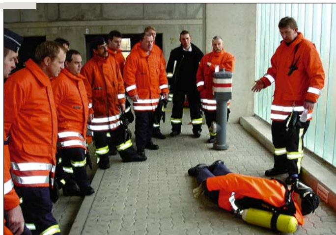
Ausbildung: Heute erfolgt die Ausbildung der Feuerwehrleute an der Landesfeuerwehrschule Schleswig-Holstein in Harrislee.

Um das frei werdende ehrenamtliche Personal sinnvoll einzusetzen, wurde ein neuer einheitlicher Ausbildungsplan beschlossen. Damit war der Weg vom „Löschknecht“, der nur eine Aufgabe zu erfüllen hatte, zum universell einsetzbaren