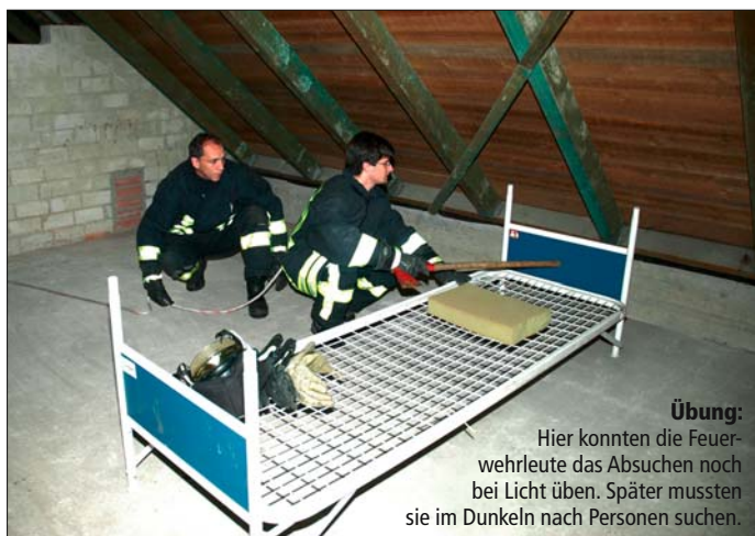
Übung: Hier konnten die Feuerwehrleute das Absuchen noch bei Licht üben. Später mussten sie im Dunkeln nach Personen suchen.

schutzgeräteträger gingen dabei mit zwei Mann pro Trupp in das Übungshaus. Nach dem „Türcheck“ (es wird geprüft, ob die Tür durch das Feuer schon heiß ist) hieß es „1-2-3“ vom Truppführer und die Tür flog auf. Der Truppmann am Strahlrohr hielt einen Stoß Wasser unter die Decke. Danach wurde die Tür sofort wieder zugezogen. So konnte man die Temperatur im Raum senken. Das ganze wurde noch einmal wiederholt. Arne Mundt