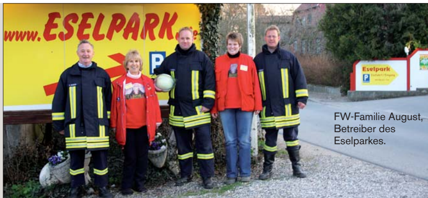
FW-Familie August, Betreiber des Eselparkes.

Der Eselpark ist der Wohlfühlpark bei jedem Wetter mit den vielen überdachten Freigehegen, Stallungen und einer großen natürlichen Spielscheune. Ein familienfreundliches Restaurant, Kinderspielplatz, tolle Esel-Souvenirs und verschmuste Eselfohlen freuen sich auf Ihren Besuch.