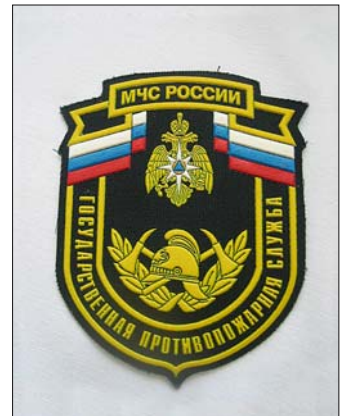
Kennzeichen: Ärmelwappen der Berufsfeuerwehr Kaliningrad.

Weitere Kameradschaftstreffen fanden bei den Feuerwehren in Litauen, Estland und Lettland statt. Kaliningrad (Königsberg) und Vilnius waren weitere Höhepunkte der Reise. Die Reisegruppe traf