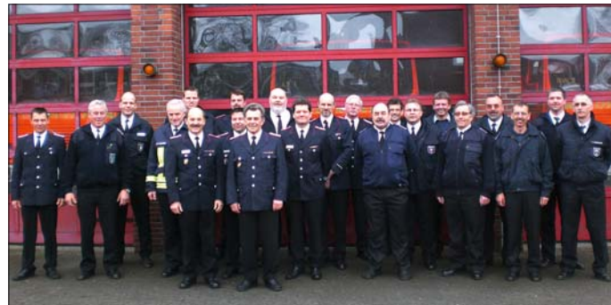
Erfahrungsaustausch: Die Schirrmeister der Kreisfeuerwehrezentralen trafen sich zu einem Forum in Rendsburg.