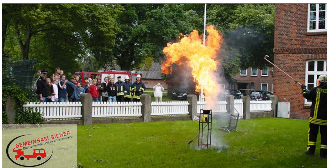
Ungewöhnlich: Auf die Konfirmanden in Eichede und die Teilnehmer am 3. KonfiCamp auf Fehmarn, hatte die Demonstration einer Fettexplosion eine große Wirkung.

... Brandschutzaufklärung für Konfirmanden