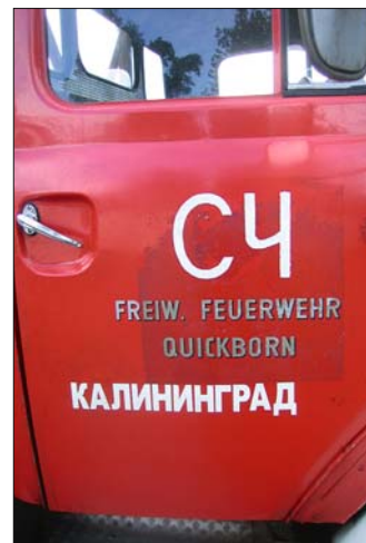
Neue Farbe: Die umlackierte Tür der Quickborner DL.

immer wieder auf die Spuren der Kreuzzüge des Deutschritterordens im Mittelalter, auf die christliche Missionare und deutsche Kaufleute folgten. Diese Einflüsse sind in der Architektur der Städte noch heute erkennbar. Beispielsweise die stattlichen Bürgerhäuser von Riga, die barocke Altstadt von Vilnius oder der mittelalterliche Stadtkern von Tallin.