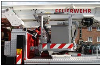
Unterwegs: Der Rettungskorb in Transportstellung.

Das neue Teleskopgelenkmast-Fahrzeug der Berufsfeuerwehr Neumünster ersetzt ein Drehleiterfahrzeug aus dem Jahre 1980, das seine Altersgrenze erreicht hat und nun verkauft werden soll.