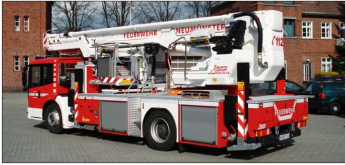
Neufahrzeug: Der neue Teleskopgelenkmast der BF Neumünster wurde von Bronto Skylift aufgebaut und ersetzt eine Drehleiter.

Das neue Teleskopgelenkmast-Fahrzeug der Berufsfeuerwehr Neumünster ersetzt ein Drehleiterfahrzeug aus dem Jahre 1980, das seine Altersgrenze erreicht hat und nun verkauft werden soll.