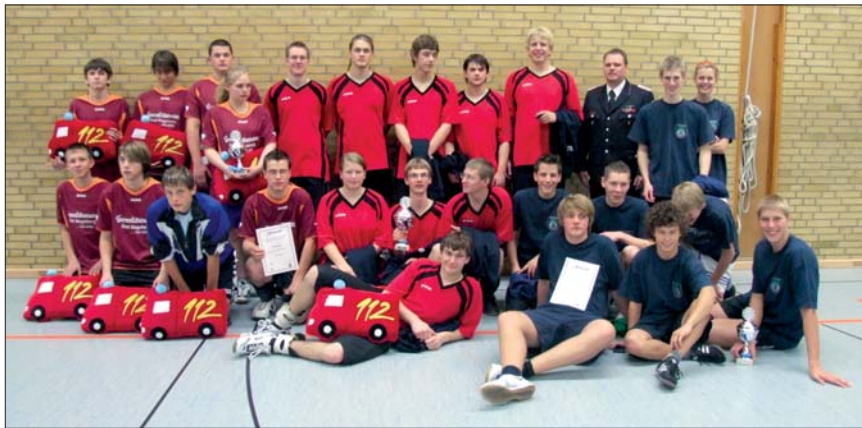
Landesmeister: Die Jugendfeuerwehr Weede (Mitte) siegte beim 12. Landesentscheid im Volleyball der SH-Jugendfeuerwehren. Auf dem zweiten Platz landete die JF Sarlhusen (rechts) vor der JF Goldenbek.