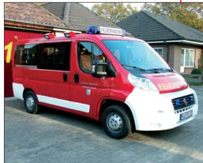
Foto: Mehrzweckfahrzeug aus Lebrade

Weiter gehören zur Ausrüstung: vier Arbeitsscheinwerfer, Blaulichtbalken, Frontblitzer, zur Verkehrssicherung Leitkegel und Blitzer, Anhängerkupplung, ein 6-kg-Pulverlöcher, 40 Liter Schaummittel und Schwerschäumenausrüstung sowie Schlauchbrücken und ein Hydro-Schild.