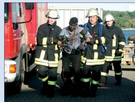
Verletzte: Die Menschenrettung hätte im Realfall auf See vor der Schiffssicherung zurück stehen müssen.