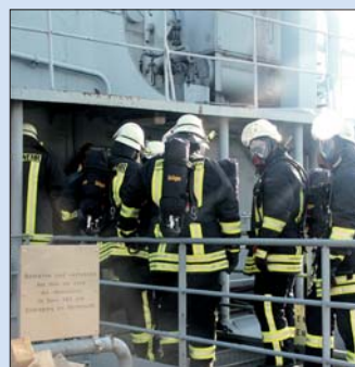
Innenangriff: Truppweise ging es zum Löschangriff im Inneren des Schiffes vor.

Zeitgleich wurde die Sicherung des Schiffes vorgenommen. Im Realfall auf See hat die Schiffssicherung Vorrang vor der Menschenrettung. Die Feuerwehr baute die Wasserversorgung für den Löschangriff auf. Von außen wurde der Schiffskörper auf Höhe der Brandstellen gekühlt. Andere Trupps rüsteten sich für den Innenangriff mit Atemschutzgeräten aus. Gemeinsam mit dem Wachhabenden Offizier und dem Wachhabenden „Schiffstechnik“ führen Einsatzleitung und Gruppenführer der