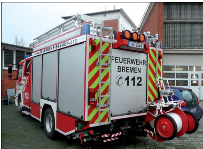
Aufbau: Der Fahrzeugaufbau der neuen Fahrzeuge stammt von der Firma Ziegler aus Gingen. Er wurde auf einem Fahrgestell von Mercedes-Benz Typ ATEGO mit vollautomatischem Allison-Getriebe aufgebaut.