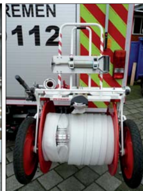
Design: Das HLF erscheint auch in dem bekannten Bremer „Speckflaggen-Design“ mit der Grundfarbe Rot und weißer Bekleidung sowie gelben Reflexstreifen am Fahrzeugheck.

Es wird schwieriger in Zeiten leerer Kassen neue Fahrzeuge zu beschaffen und den Fahrzeugpark auf dem aktuellen Stand der Technik zu halten. In einigen Wehren fallen die Löschfahrzeuge regelmäßig aufgrund ihres Alters aus.