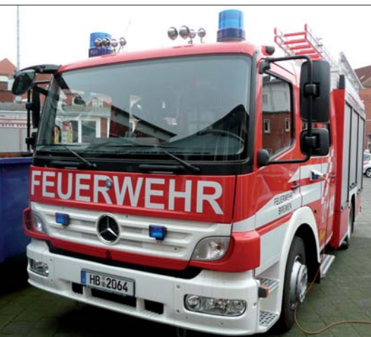
Neubeschaffung: Drei neue HLF beschaffte die Bremer Feuerwehr. Sie werden auf den Wachen 1, 2 und 5 stationiert.