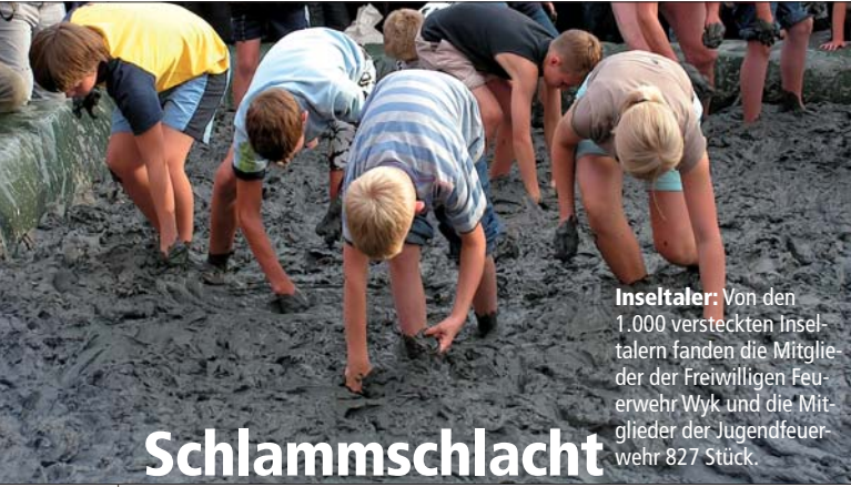
Inseltaler: Von den 1.000 versteckten Inseltalern fanden die Mitglieder der Freiwilligen Feuerwehr Wyk und die Mitglieder der Jugendfeuerwehr 827 Stück.