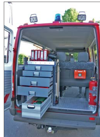
Platz spendend: Kleinutensilien lassen sich bequem in den Schubkästen unterbringen.

sässige Firmen bei. Die Umbaukosten zahlte die Wehr aus ihrer Kameradschaftskasse. Dazu gab es einen Zuschuss vom Kreis und der Gemeinde. Das Fahrzeug wird überwiegend von der Jugendfeuerwehr als Transportfahrzeug genutzt, lässt sich aber mit wenigen Handgriffen zum Einsatzleitfahrzeug umbauen. In dem Fahrzeug sind die nötigen Einsatzmittel, mit entsprechendem Rundumlicht und Außenbeleuchtung, für eine Verkehrssicherung gelagert. Der Schubkastenschrank im hinteren Teil des Fahrzeuges lässt sich bei Bedarf leicht ausbauen, um andere benötigte Einsatzmittel zu transportieren. Heinrich Overath