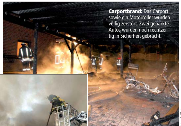
Carportbrand: Das Carport sowie ein Motorroller wurden völlig zerstört. Zwei geparkte Autos wurden noch rechtzeitig in Sicherheit gebracht.

Ein Feuer in der Dachgeschosswohnung eines Mehrfamilienhauses in der Bürgermeister-Oetken-Straße in Mölln breitete sich rasend schnell aus und zerstörte das Mehrfamilienhaus. Wie durch ein