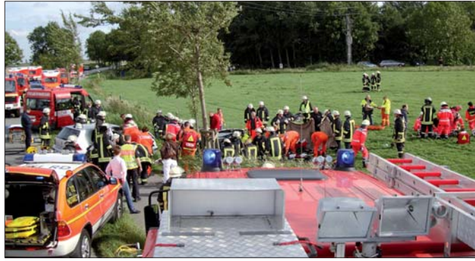
Großeinsatz: Sieben Personen waren in diesem schweren Verkehrsunfall zweier Kleinwagen auf der Bundesstraße 203, Höhe Österdeichstrich verwickelt und wurden in einer groß angelegten Rettungsaktion gerettet.

Nach einem schweren Verkehrsunfall zweier Kleinwagen auf der Bundesstraße 203, Höhe Österdeichstrich (Dithmarschen) lief eine groß angelegte Rettungsaktion an: Sieben Personen mussten gerettet und medizinisch versorgt werden. Alarmiert wurden acht Rettungswagen, zwei Notärzte, ein leitender Notarzt sowie ein organisatorischer Leiter vom Rettungsdienst. Weiter wurden vier Rettungshubschrauber zur Unfallstelle beordert. Die Büsumer Polizei sperrte die Bundesstraße im Unfallbereich weiträumig ab. Die Freiwilligen Feuerwehren Warwerort, Wöhrden und Büsum waren mit 57 Feuerwehrleuten im Einsatz. Sie hatten die Aufgabe die Einklemmten aus dem Autowrack zu befreien und den Rettungsdienst zu unterstützen. Mit hydraulischem Gerät mussten die Türen entfernt werden, um die Personen aus dem Fahrzeug zu befrei-