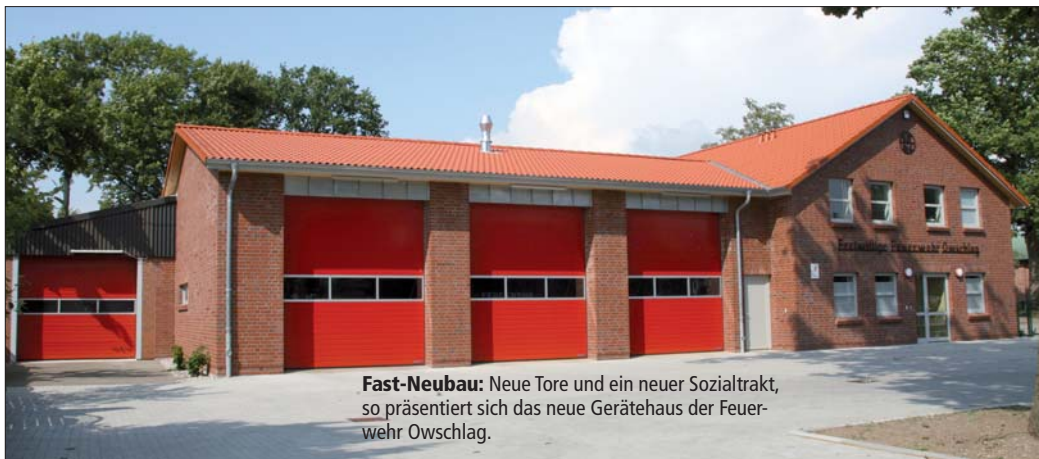
Fast-Neubau: Neue Tore und ein neuer Sozialtrakt, so präsentiert sich das neue Gerätehaus der Feuerwehr Owschlag.