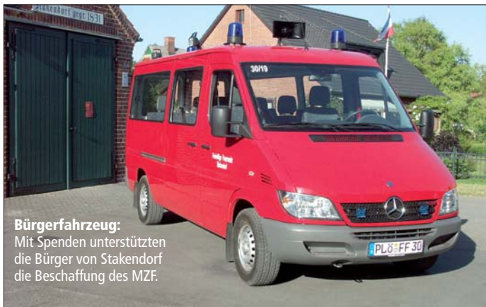
Bürgerfahrzeug: Mit Spenden unterstützten die Bürger von Stakendorf die Beschaffung des MZF.