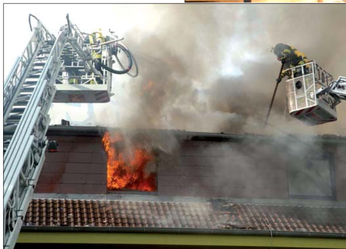
Altbau: Die Löscharbeiten gestalteten sich äußerst schwierig, weil das Gebäude ein Altbau war und sehr viel Holz verbaut war.

aus gemeldet werden. Die Kriminalpolizei Lübeck nahm noch in der Nacht die Ermittlungen auf. Zur Brandursache und Schadenshöhe konnten am Sonntag noch keine Angaben gemacht werden.