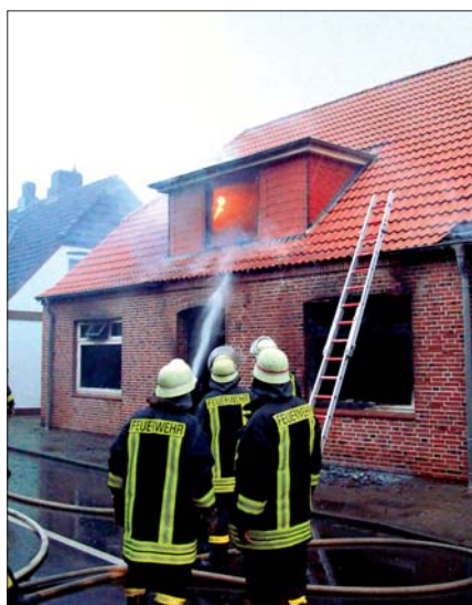
Flammenhöhle: Beim Eintreffen der Feuerwehr Wesselburen stand der untere Bereich dieses Hauses bereits lichterloh in Flammen.

Beim Brand eines Einfamilienhauses in der Kleinstadt Wesselburen (Dithmarschen) kam ein Bewohner ums Leben. Beim Eintreffen der Feuerwehr stand der untere Bereich des Hauses bereits in Flammen. Wehrführer und Einsatzleiter Karl-Heinz Paap ließ sofort die Nachbarwehr Süderdeich nachalarmieren. Eine Person hatte das Haus rechtzeitig