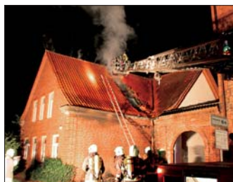
Hoher Sachschaden: Ein Feuer im Dachstuhl des bekannten Rendsburger Kulturzentrums in der Arsenalstraße richtete hohen Sachschaden an.

Ein Feuer im Dachstuhl des landesweit bekannten Rendsburger Kulturzentrums in der Arsenalstraße richtete in der Nacht zum Montag (14.7.) hohen Sachschaden an. Der Brand entstand aus