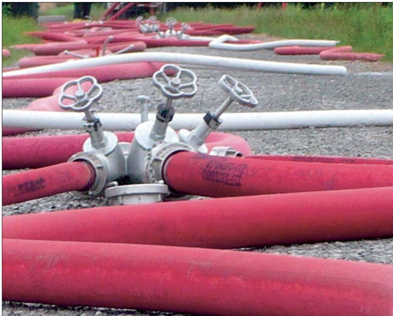
Löscheinsatz: Durcheinander oder alles im Griff?