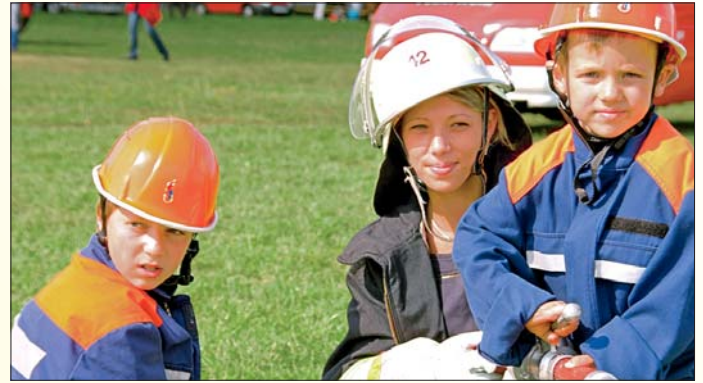
Glücklich: Die zwei jungen Akteure konnten unter fachlicher Anleitung Feuerwehrmann sein.

machtag“ auch unter dem Focus, gezielt Jugendliche zum „Mitmachen“ anzusprechen. Die Mitgliedschaft in einer Jugendfeuerwehr ist darüber hinaus eine sinnvolle Freizeitgestaltung bei der Teamgeist und die individuellen Fähigkeiten der Jugendlichen mit Spaß und Engagement für die ehrenamtlichen Aufgaben in der Ge-