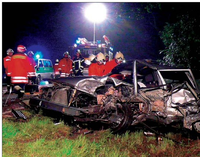
Eingeklemmt: In diesen Trümmern starb der 34-Jährige. Seine Beifahrerin konnte mit schweren Verletzungen gerettet werden.

Den Einsatzkräften der Freiwilligen Feuerwehr Kropp bot sich ein wahres Trümmerfeld. Fahrzeugteile eines Ford-Fiesta, z. B. der Motor, lagen bis zu 50 Meter weit über die Fahrbahn verstreut. Ein 35-jähriger Mann aus Owschlag starb bei diesem schweren Verkehrsunfall. Zwei weitere Personen wurden schwer verletzt. Ersten Angaben zufolge war der aus Richtung Schleswig kommende Fiesta auf die Gegenfahrbahn geraten und dort mit einem Mercedes-Kombi frontal zusammengestoßen. Der Mercedes-Fahrer wurde hierbei in seinem Fahrzeug eingeklemmt. Für ihn kam jede Hilfe zu spät. Die Beifahrerin sowie die 54-jährige Fahrerin des Ford Fiesta erlitten schwere Verletzungen und wurden ins Krankenhaus gebracht. Die Notfallseelsorger der Feuerwehr betreuten die Angehörigen des Toten, die an die Einsatzstelle geeilt waren. Thomas Neubert