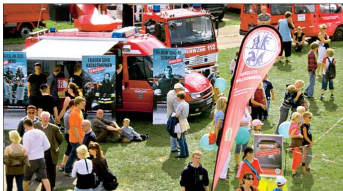
Infostand: Der Informationsstand des LFV inmitten des Geschehens.