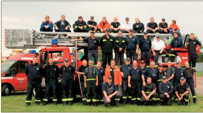
Mitmachakteure: Mit über 40 Helfern aus den Feuerwehren Kiel-Dietrichsdorf, Gettorf, Büdelsdorf, Bredenk, Krummwich und Kropp war der LFV im NORLA-Einsatz.

erst später zeigen: Die Wehrführer der Gemeinden aus denen Teilnehmer kamen, werden angeschrieben und darum gebeten, sich mit den Interessierten persönlich in Verbindung zu setzen.