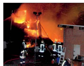
Großfeuer: Das kombinierte Wohn- und Wirtschaftsgebäude auf einem Bauernhof in Hamberge (Kreis Stormarn) wurde vollständig zerstört.

Ein Großfeuer hat ein kombiniertes Wohn- und Wirtschaftsgebäude auf einem Bauernhof in Hamberge (Kreis Stormarn) vollständig zerstört. Nachbarn hatten gegen 00:53 Uhr das Feuer in der Straße „Am Denkmal“ bemerkt