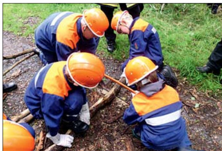
Teamarbeit gefragt: Auch beim Einsatz „Baum auf Stromleitung“ bewältigten die jungen Kame- raden ihren Auftrag mit Bravour.