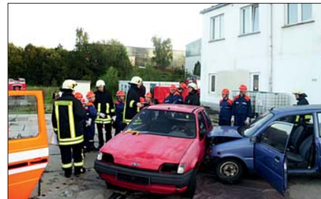
Komplizierte Aufgabe: Zu den schweren Ein- satzaufgaben zählte ein Verkehrsunfall.