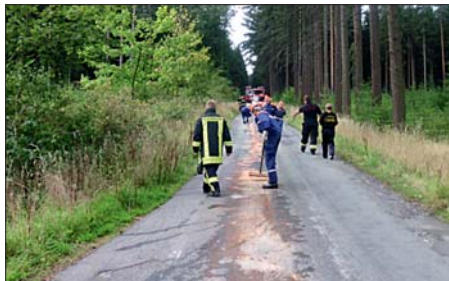
Der erste Einsatz: Professionell beseitigten die Mitglieder der JF Zeulenroda eine Ölspur.