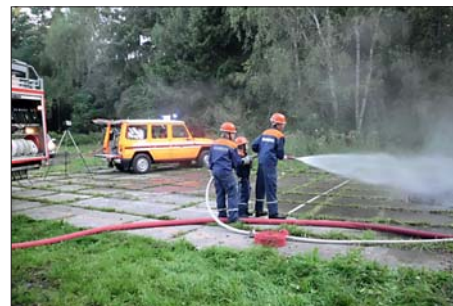
Krönender Abschluss: Beim letzten Einsatz der „24-Stundenschicht“ war ein „Waldbrand“ zu bekämpfen.