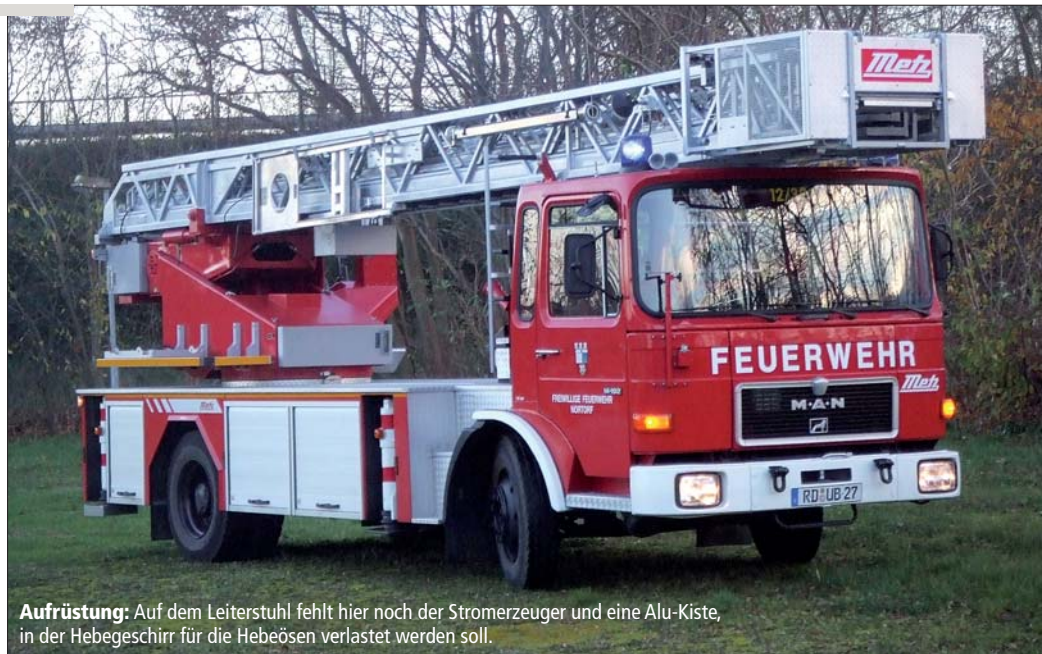
Aufrüstung: Auf dem Leiterstuhl fehlt hier noch der Stromerzeuger und eine Alu-Kiste, in der Hebegeschirr für die Hebeösen verlastet werden soll.

Neu im Fahrzeugpark der Freiwilligen Feuerwehr der Stadt Nortorf ist eine DLK 23-12. Das Fahrzeug stand wie aus dem Ei gepellt bei Metz Aerials in Karlsruhe auf dem Hof und wartete auf neue Herausforderungen. Seit 1986 versah der MAN 14.192 bei der Berufsfeuerwehr Berlin Dienst und wurde schließlich bei Metz in Zahlung gegeben. Dort baute man das Fahrzeug komplett auseinander und wieder zusammen. Das Podium wurde neu aufgebaut, der Leiterpark sandgestrahlt, neu lackiert und die Kabelführung ins Innere des Leiterparks gelegt. Charakteristisch ist jedoch die niedrige Bauart des Chassis, mit