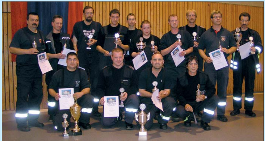
sternfahrt-gruppe: Die Sieger der Sternfahrt 2007 des Kreisfeuerwehrverbandes Ostholstein.

alle Teilnehmer wussten, dass in Not geratene Einsatzkräfte „Mayday, Mayday“ rufen. Schwieriger wurde es bereits, als nachgefragt wurde, wer nach der jetzt gültigen Feuerwehr-Dienstvorschrift 3 den Verteiler setzt. Nicht jede Disziplin blieb fehlerlos. An einem weiteren Hindernis wurde überprüft, ob der Fahrer seinen Führerschein mitführt. Keiner der Teilnehmer hatte seinen Führerschein vergessen.